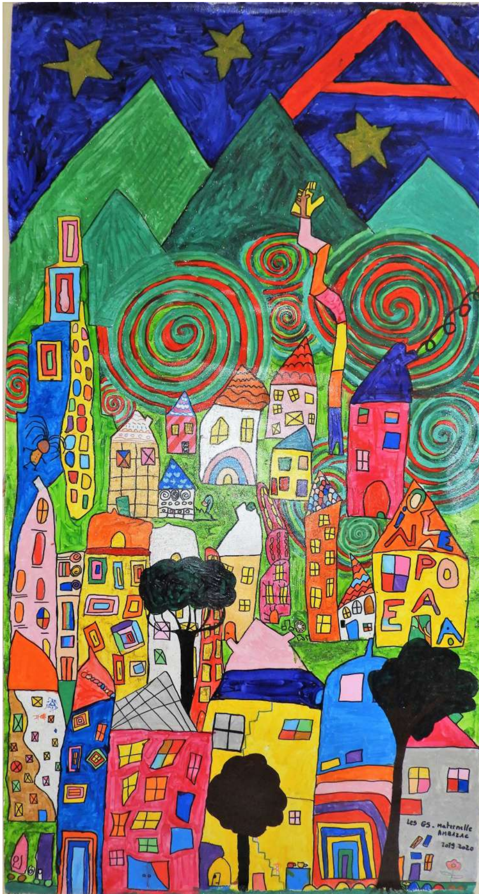
HAÏKU DES GRANDES SECTIONS DE MME SIRA-REPERT de l'école maternelle Charles Perrault d'Ambazac.

La lumière éclaire la rue Le bruit encombre la ville Le train roule sur les rails Les voitures passent bruyamment L'odeur succulente du pain au chocolat